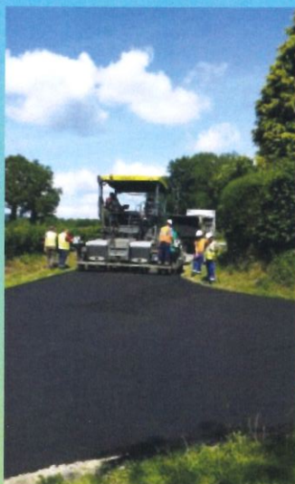
Ent. EUROVIA dans le village de Villette